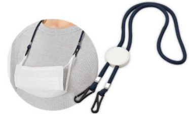
※マスクは付属しません

ちなみに本年度購入グッズはマスク関連グッズとなりましたが、「あったらいいな」便利グッズだと思っております。事務職員の先生方だけではなく「共助会係事務だより」を見る機会のある会員の方からのご要望にもお応えしたいと思っておりますので、お声かけ下さい。