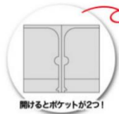
開けるとポケットが2つ！

会員数 500 人の拡大を目標に未入会の教職員がおられる学校（職場）を訪問しておりますが、対象者がおられない学校へも事務職員の先生方にご挨拶に伺うことがあります。そのときに共助会に対しての助言等をいただければ幸いです。訪問の際は、昨年度購入グッズ！エコバック、本年度購入の