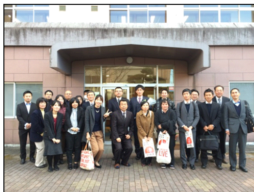
曾於市事務職員会のみなさんと