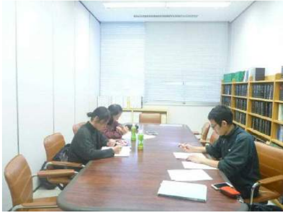
事務研の様子（喜界町役場会議室）

こんにちは、喜界町立小中学校事務職員会です。私たちは、3名という少ない人数で、事務職員研修会と事務支援室を運営しています。喜界町立小中学校事務職員研修会は年に6回開催しており、町費事務の事務改善を中心に研修に取り組んでいます。具体的には、就学援助事務の支給方法や、学校給食費の徴収方法に関する事務改善について、情報収集や徴収に関する制度・運用上の課題等を検討するため、町教委やその他関係者と協議を重ねているところです。