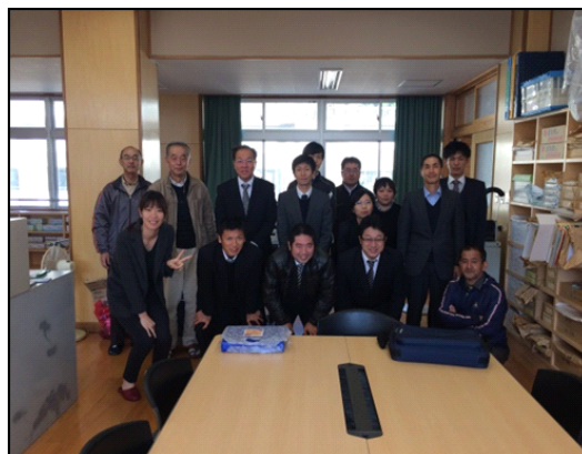
国分第2支援室のみなさんと

これからもメンバー全員協力して頑張りたいと思いますので、皆様どうぞよろしくお願いいたします。