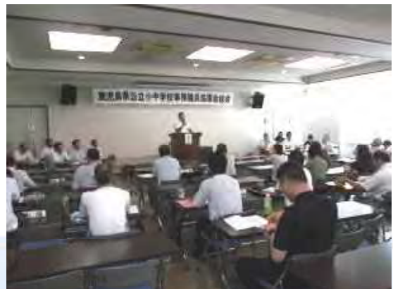
今年も各地区から総代の方々が集まりました。