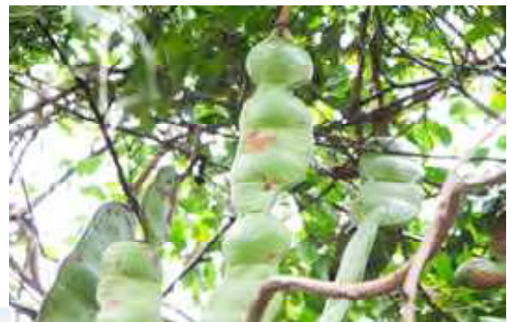
（大河ドラマ「西郷どん」ロケ地 宮古崎（大和村）） （住用のマングローブ「モダマ」世界最大の豆）