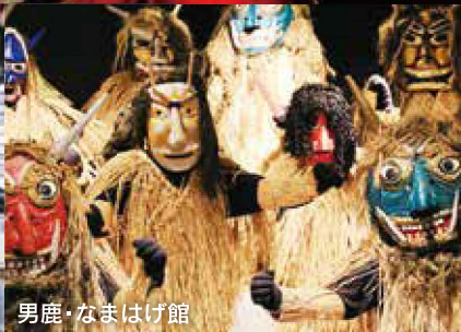
男鹿・なまはげ館