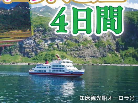
知床観光船オーロラ号