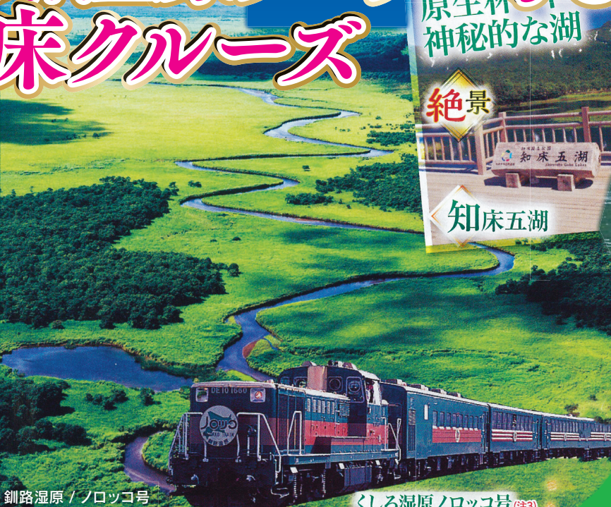
釧路湿原 / ノロッコ号