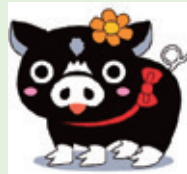
《コープのブーコです。》登録商標

2015年7月からは鹿児島の焼酎を販売することにより、鹿児島県の伝統文化であり特産品である本格焼酎の販売に関わることで、本県産業の振興にも寄与しています。また、2017年2月からは、家庭への電力自由化に伴い、指定店契約を結んだ太陽ガスが小型小水力発電などで発電した再生可能な自然エネルギーを家庭に供給しています。